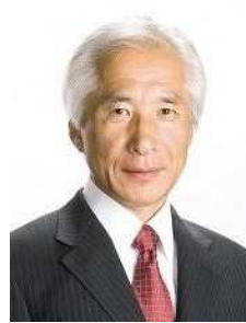
兵庫県養父市長 広瀬栄氏