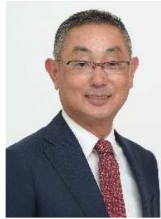
宮崎県高鍋町長 黒木敏之氏